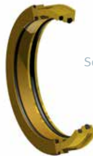
Sello Inpro Seals

Sellos de aceite — Todos los sopladores CycloBlower incluyen sellos patentados de aislación de cojinetes. Nuestro exclusivo diseño desarrollado de manera conjunta con Inpro/Seal ofrece un rendimiento y longevidad sobresalientes (no están disponibles en los modelos 3CDL y A5CDL).