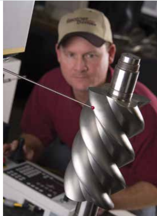
Inspecciones de componentes esenciales = Productos de calidad

Sellos de aire y gas — Los sellos del eje de tipo laberinto permiten una pérdida mínima controlada de aire o gas. Hay sellos mecánicos o sellos de laberinto de purga disponibles con unidades que manejan gases, donde la pérdida no es admisible (los sellos mecánicos no están disponibles en los modelos 3CDL y A5CDL).