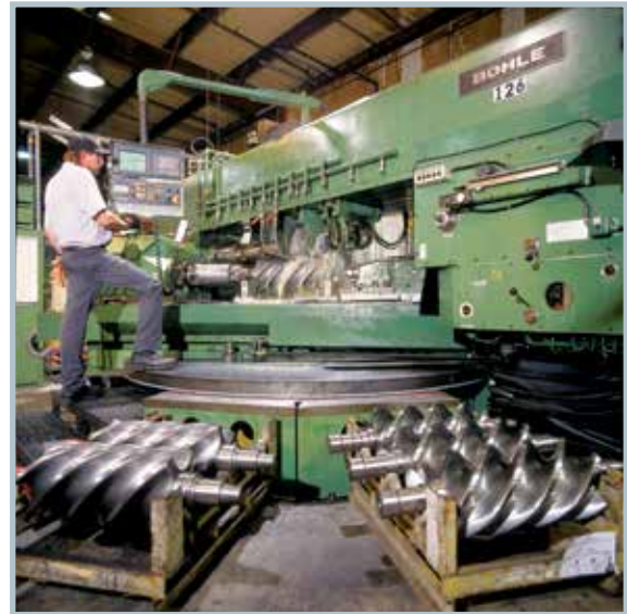
Los rotores CycloBlower se rectifican con precisión usando tecnología de fresado de última generación.